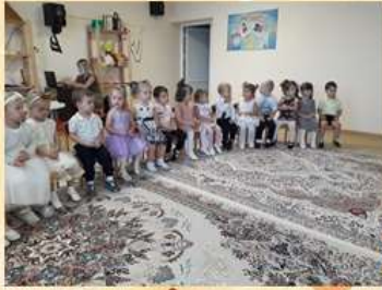
Праздник Осени в 1 младшей группе № 01