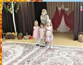
Праздник Осени в детском саду. Старшая группа 04