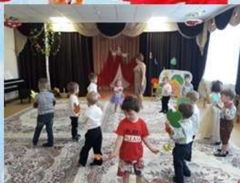
Праздник Осени во 2 младшей группе № 03