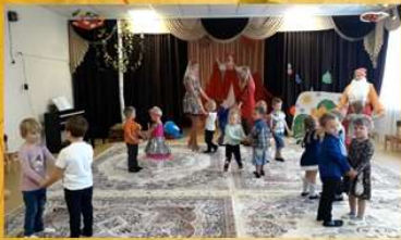
Праздник Осени в детском саду. 2 мл. группа №02